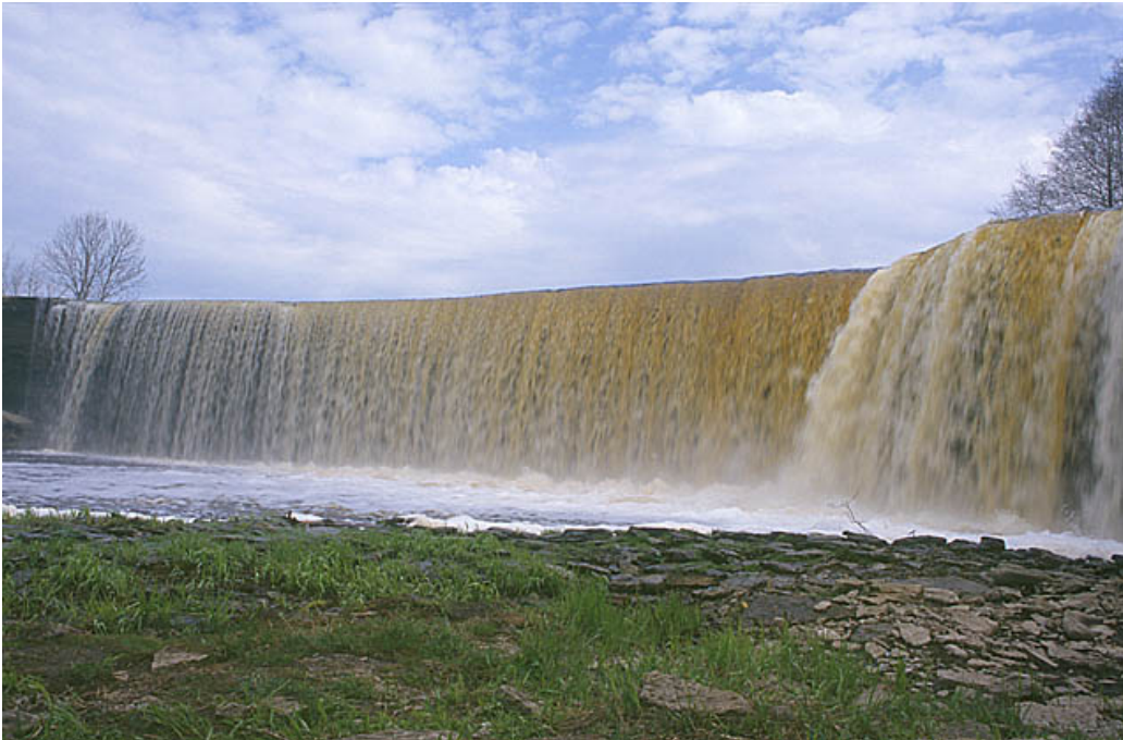
Eesti suurim juga Jägala juga

Põhjarannikul võib tekkida vajadus ületada järsakuid või püstseinu ning kohata ka jugasid.