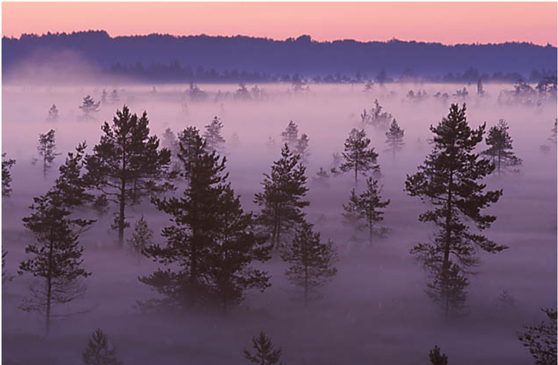
udu rabas koidikul