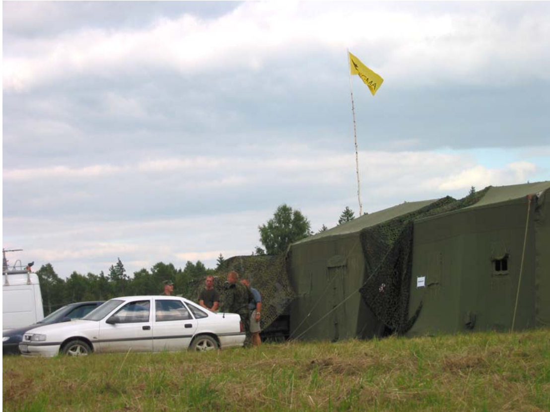
"Erna retk 2002" võistluste staap

Operatiivülem – SSS "Erna" juhatuse poolt kutsutud ohvitser, kes vastavalt seltsi poolt välja töötatud põhimõtetele ja juhenditele juhib ja koordineerib operatiivteenistuste tööd. Tema alluvusse kuuluvad: trassiteenistus, vastutegevus, päästeüksus ja ohutustehnika. Operatiivülem kuulub staabi koosseisu.