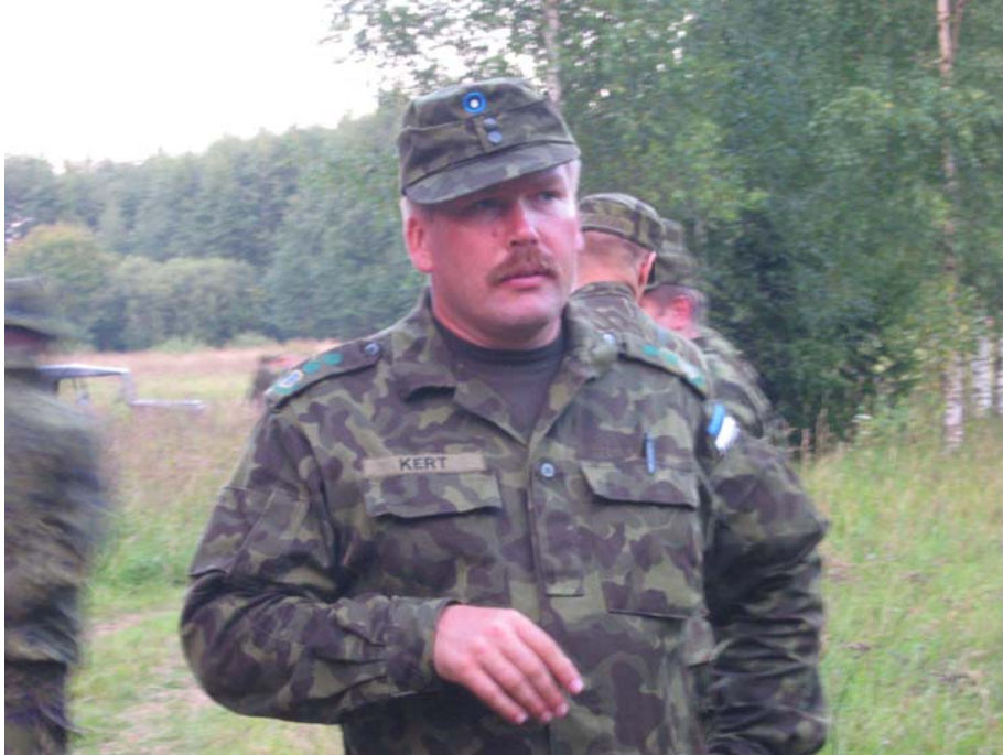
"Erna retk 2002" võistluste ülem kindral-leitnant Johannes Kert

Võistluste ülem – SSS "Erna" juhatuse poolt kutsutud ohvitser, kes vastavalt seltsi poolt väljatöötatud põhimõtetele ja juhenditele juhib ning kontrollib võistluste kulgu. Tema tööorganiks on võistluste staap. Ülema ametisoleku kestvus on üks aasta (vähemalt 1 aastase vaheajaga).