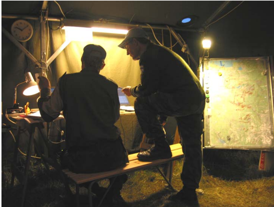
“Erna retk 2002” kohtunike staap

Kohtunike staap – on peakohtuniku tööorgan, mis koordineerib ja kontrollib vastavalt seltsi poolt välja töötatud põhimõtetele ja juhenditele kohtunike tegevust kontrollpunktides, lahingkäsu territooriumil ja vastutegevuses. Viib läbi koos võistluste staabiga vähemalt ühe koosoleku päevas võistkondade esindajatele, kus jagatakse vastastikku informatsiooni ja võetakse vastu esindajatelt tulevad võimalikud protestid ning tähelepanekud.