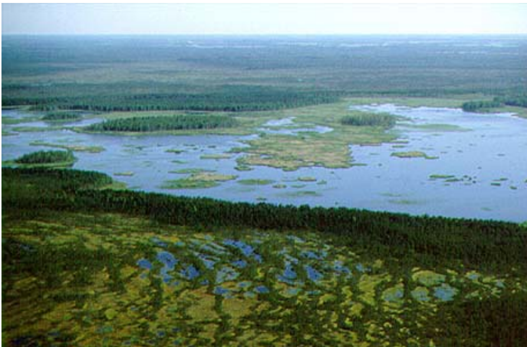
raba üleminek järveks

Tähelepanelik tuleb olla maastiku vaheldumisega. Märkamatu võib ühest keskkonnast sattuda teise.