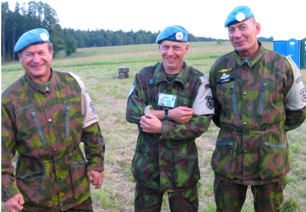
Võistluste kohtunikud ja eraldused

“0” võistkond – võistluste kontrollvõistkond, mis stardib 2 tundi enne võistlevaid võistkondi. Tema ülesandeks on kontrollida võistluste trassi paikapidavust nii ajalises, tehnilises kui ka ohutustehnilises mõttes. Annab jooksvat informatsiooni võistluste trassi ülemale.