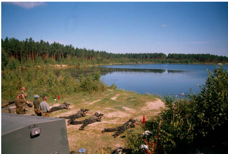
Laskmine automaatreelvast kontrollpunktis

1. Kontrollpunktid – Kontrollpunktid on vastavalt võistluste legendile ja ajagraafikule maastikul määratud punktid, kus võistkonnad näitavad erinevate relvakäsitsemise ja sõdurioskuste taset. Andmed kontrollpunktide kohta avalikustatakse nii võistkondadele kui ka vaatlejatele ja külalistele võistluste eelsesel päeval.